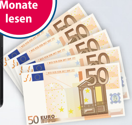
250 € Taschengeld