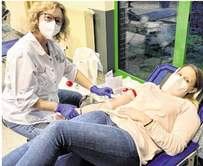
Während der Pandemie gelten zusätzliche Maßnahmen bei der Blutspende. So ist das Tragen einer Maske Pflicht und ein Termin muss vereinbart werden.

saison zu begrüßen, erhalten außerdem alle SpenderInnen auf den DRK-Spendeterminen in Schleswig-Holstein und Hamburg am Freitag, 14. Mai, Freitag, 21. Mai und am Pfingstmontag, 24. Mai, eine exklusive Grillzange als Dankeschön für ihre Unterstützung.