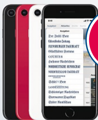
iPhone SE, 64 GB (einmalige Zuzahlung 99 €)