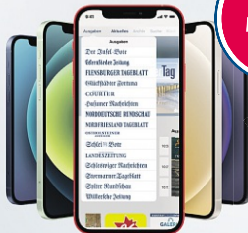
iPhone 12 mini, 64 GB (einmalige Zuzahlung 299 €)