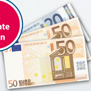
120 € Taschengeld